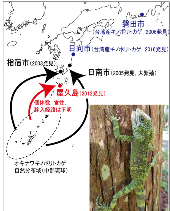
図1. キノボリトカゲの外来個体群と移入年

これまで申請者らは、本亜種の原産地である琉球列島において、遺伝的多様性、分布域、胃内容物等、長く両生・爬虫類の研究を行ってきた。こうした基礎調査に加え、分子生物学的手法を用い、同一種内あるいは単一島嶼内に進化的に独立な個体群が複数存在すること、類似した分布パターンを示す場合であっても異なる遺伝的分化パターンを示すものがあること等も明らかにしてきた。このように蓄積された知見と、移入先で得られる新情報を統合すれば、移入先での生態的な特性や移入経路をより正確に吟味し、総合的で一般化可能な考察ができると考え、本研究の立案に至った。