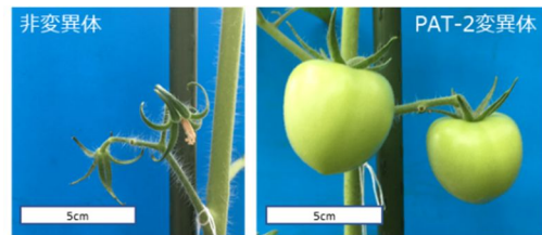
図 3. 未受粉果実の着果 PAT-2 変異体は未受粉でも着果・肥大した。 開花前日に柱頭を除去した。

今回変異体の得られなかった他のホモログ遺伝子についても変異体の作出による解析が望まれる。