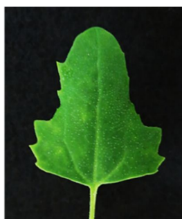
図 2 CNSVを保持した Xiphinema bakeri を接種した Chenopodium quinoa の退緑斑点症状

CNSV および ArMV の各ウイルスを感染させた C. quinoa の根回土壤に X. bakeri を放飼して 2 週間育成した結果、すべての株で根のウイルス移行を確認した。また、 X. bakeri 30 頭の検定で両ウイルスは RT-PCR 法および RT-nested PCR 法で陽性となり、 X. bakeri のウイルス保持を確認した。