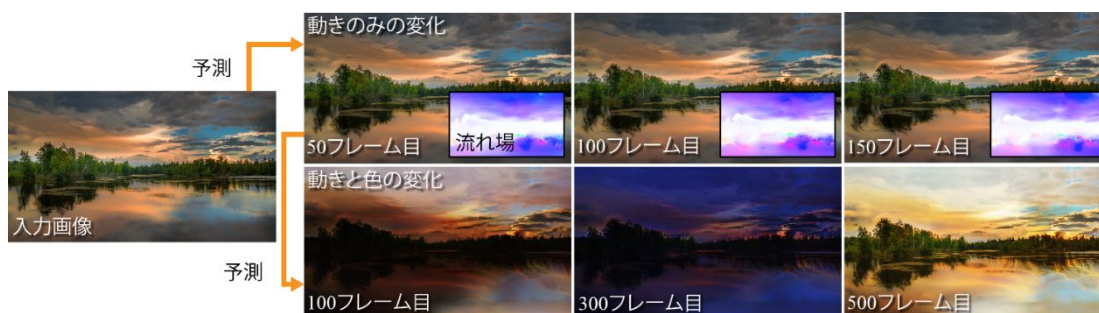
図1: 本技術により静止画像から予測した動きと色の変化

今回開発した技術では、深層ニューラルネットワークを用い、1枚の静止画像から高品質な動画を生成する。本研究は空の雲や湖の水の動き、1日の昼夜変化などを含む風景のシーンを対象に、Web上で比較的容易に手に入るタイムラプス動画を訓練データとして教師なし学習を行う。自然景観は、1日のうちに数秒単位で雲や水面が動くだけでなく、数分から数時間単位で夜になるにつれて色も変化していく。これらすべての要素を考慮するには長期間のフレームを小刻みに予測する必要があるが、予測できる長さには限界がある。そこでまず一つの工夫点は、動画中のアニメーションを動き（モーション）と外見の色（アピアランス）の変化の二つの要素に分解して考え、2種類のニューラルネットワークモデルにこれらを学習させることである。図1に示す通り本技術によって、動きと色の変化を複合的に扱うことができる。