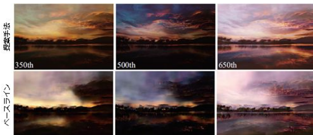
図2: 動画を直接生成したベースラインと色変換マップを使って生成した提案手法との比較

二つ目の工夫点として、モーション用とアピアランス用の各畳み込みニューラルネットワーク（CNN）には動画を直接生成させず、入力画像を変換するためのモーションと色変換マップを予測させる。そしてこれらのマップに正則化をかけることでモデルの汎化性能の向上を図る。この際モデルの複雑さを減らし学習コストを削減するために、従来研究において主流であった3D畳み込み層を使うのではなく、2D畳み込み層を使い複数枚の画像を生成するアプローチを採用する。2D畳み込みによって計算された各マップにもとづき、入力画像にワーピングと色変換を適用することで、各フレームの出力を生成する。図2は動画を直接生成したベースラインと、本工夫により生成した提案手法によって得られる結果を比較したものである。アーティファクトによるちらつきが生じるベースラインに対して、提案手法はアーティファクトの少ない安定した結果を得られる。