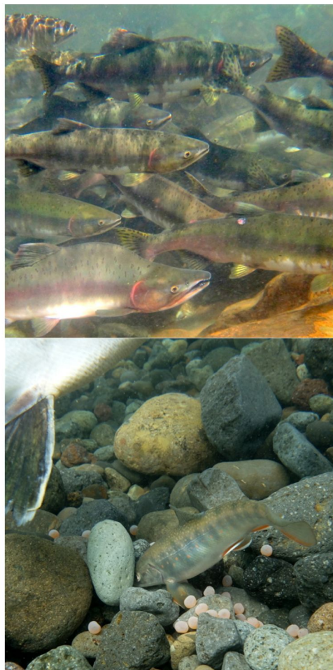
上: 遡上するカラフトマス

知床半島の河川に生息するオシヨロコマの主な繁殖時期である 10 月下旬に、砂防ダムがサケ類の遡上を妨げている河川と妨げていない河川でオシヨロコマのサンプリングを繰り返し実施した。それらのサンプリングで得られた個体について、体長と体重の計測、雌雄判別と成熟の有無の確認を行った。また、5%ホルマリン液に保存した成熟メスの卵サンプルについて、卵一粒あたりの重量を計測し、卵サイズの指標値を得た。卵サイズについては、体サイズの影響を補正するために、統計的に体長の影響を考慮した。上記で得られたデータから肥満度と成熟サイズ、卵サイズについて、砂防ダムがサケ類の遡上を妨げている河川と妨げていない河川の間で比較を行った。