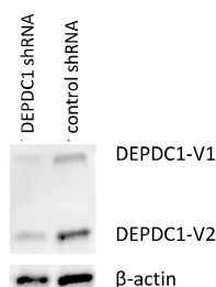
図 1 imBTSC における DEPDC1 knockdown の効果

誘導脳腫瘍幹細胞(imBTSC)に対し、shRNA を用いて DEPDC1 を knockdown し、発現が抑制されていることを western blot で確認した(図 1)。作成した shDEPDC1-imBTSC の in vitro における増殖実験を行ったところ、DEPDC1 を抑制することで、むしろ imBTSC の増殖が促進されることが確認された。