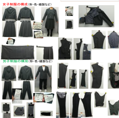
Fig. 4 制服の出来上がりと縫製前のパーツ構成