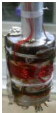
Fig.1 希釈冷凍機用熱測定セル

低温領域から測ることができ、各温度での緩和カーブは弱磁場領域ではほぼ完全な単一指数関数になることを確認した。Fig.1 に銀製の緩和型セルの写真を示す。こうしたコンパクトな希釈冷凍機用の熱測定装置は、国際的に見ても殆ど例がなく、特に大きな試料の作成が困難な分子性化合物の研究には有効である。