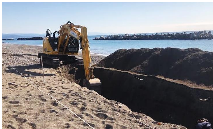
図-2 海浜トレンチの掘削状況