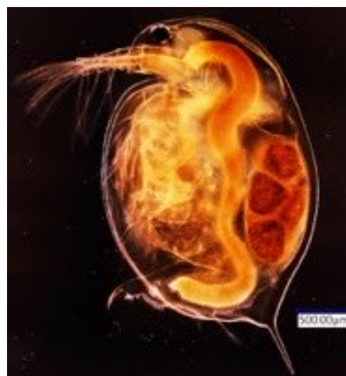
図 3. オオミジンコ Daphnia magna (体長約 2 mm)。自発的な摂食の結果、消化管内に 10 \mu\text{m} のポリスチレン PS 粒子を詰め込んだもの。水中にクロレラや PS 粒子が懸濁している限り摂食と排泄を続けた。粒子のない水中では消化管内容物は 3 時間以内に排泄され消化管は空になっ

(2) オオミジンコ ( Daphnia magna ) を用いた摂餌実験で、サイズ 10 \mu\text{m} のポリスチレン (PS) 粒子を、全く拒絶せず、消化管に詰め込むように摂食し、排泄することが明らかとなった(図 4)。餌となる植物プランクトンとともに PS 粒子を与えると、より活発に、餌と PS 粒子とを区別せずに摂食することも分かった。 D. magna は、自発的な摂食の結果、消化管内に 10 \mu\text{m} のポリスチレン PS 粒子を詰め込み、水中に PS 粒子が有る限り、摂食と排泄を続けた。粒子のない水中では、消化管内容物は 3 時間以内に排泄され、消化管は空になった。これらの結果から、自然の海洋湖沼で浮遊粒子を摂食する動物プランクトンを介して、SMPs 自体と、SMPs の表面に吸着した物質が、上位捕食者に転送され、延いては人間の体内にも入っていく可能性があるとして十分に予想された。