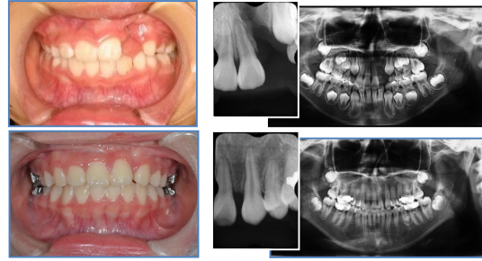
【骨移植術前後の口腔内・レントゲン写真】

骨移植術の多くは、8歳から12歳頃の低学年期に行われ、骨移植術に用いられる移植骨のほとんどが「腸骨自家海綿骨」である。自家骨は確実な骨形成能や感染に強いなどの利点はあるものの、一方では採取部位の疼痛や歩行困難、術後創部の癒痕形成などの欠点が見られる。