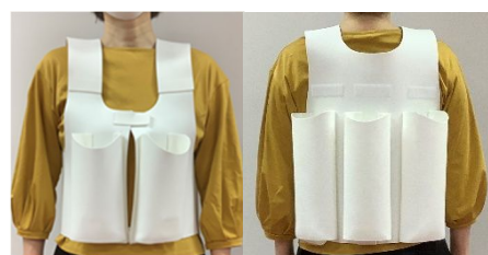
図 3 提案する運搬具の 前面(左)と後面(右)

本研究から図 3 の運搬用の上衣が提案できた。水はペットボトルやビニール袋を用いることにより小分けにして準備することで、運搬中の水の揺れを少なくして体力や体調に応じた水の運搬を行える。また運搬中の肩の痛みなどの疲労部位の発生の予防が行える可能性がある。しかし、応急給水拠点で水を小分けに袋に注水する必要もあるため今後の新たな課題である。