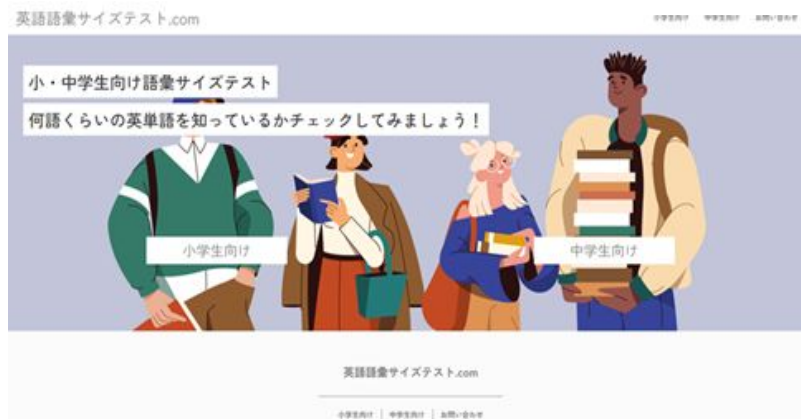
図4 デジタル版語彙サイズテストのトップ画面