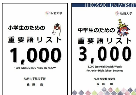
図 1 小学生のための重要語リスト 1,000 および中学生のための重要語リスト 3,000

小学生用、中学生用とも新学習指導要領に対応した検定教科書は異なり語数、総語数が大きく増加していることが明らかになった。さらに、いずれの教科書においても、学習指導要領に示されている、小学校の学習語彙数とされている 600 語から 700 語、中学校で扱われるとされている語彙数である 1,600 語から 1,800 語を異なり語数において大きく超えていることが分かる。この事からも、検定教科書には題材語に代表されるような定着を求めない語彙が多く含まれると考えられる。テキスト量が増えることでいろいろな英文に触れる機会や、良質な語彙チャンクに触れる確率も高まることになり、それだけ言語材料の引き出しが多くなったと捉えるべきである。ただし、このように増加した語彙を、年間の授業時数でどのように指導するかについては十分な検討が必要である。教科書に出現するすべての語彙を同じように指導するのではなく、語彙によって軽重をつけた指導をすることを前提とし、語彙の重要度によって定着を求める語、そのレッスンを終わったら忘れてもいい語のような区別を行い、定着を求める語により多くの時間をかける指導が必要となる。