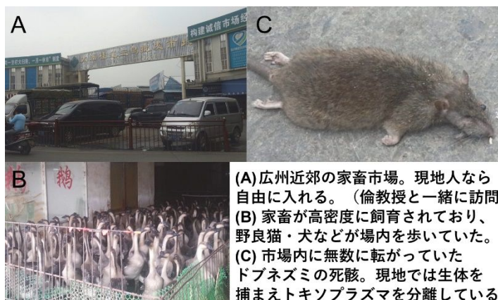
(A) 広州近郊の家畜市場。現地人なら自由に入れる。(倫教授と一緒に訪問) (B) 家畜が高密度に飼育されており、野良猫・犬などが場内を歩いていた。 (C) 市場内に無数に転がっていたドブネズミの死骸。現地では生体を捕まえてトキソプラズマを分離している。

(1) 中国の南部(広州)の食用鳥獣の卸売市場に行き(図1A, 1B)、ドブネズミを捕獲し脳を採取した(図1C)。また猫食文化がある中国南部で食用猫専門市場に行き、猫の脳及び舌片を採取した。各地の大学で各地の研究者が、これらの組織片をPBSでホモゲナイズ後、ペプシン消化して調整した懸濁液を、原虫殺傷作用を全く持たないIFN- 受容体欠損マウスの腹腔に投与し経時的に観察した。2週間後に血清を採取し、トキソプラズマの有無について抗体価を測定した。また衰弱し始めたマウスの腹腔から腹腔滲出液を採取し、原虫特異的抗体を使用した免疫染色を行い、原虫の存在を確認する。原虫が分離された場合には、マウスの個体を使った限界希釈を行い逐次株化した。