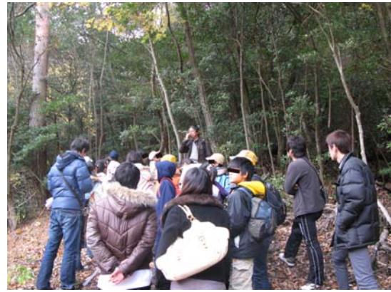
図3 フィールドワークの様子

植生遷移の知識理解の効果については、3回（プレテスト、ゲーム後テスト、フィールドワーク）のテストの比較によって行った。その結果、プレテストよりゲーム後ポストテストが高く、ゲーム後ポストテストとフィールドワーク後ポストテストは同程度である、という結果がFriedman検定により得られた( p < 0.5 )。