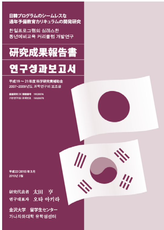
図2 研究成果報告書

また、本シラバス試案を提示するに当たっては、前半期予備教育（韓国・ソウル市・慶熙大学校国際教育院）において、日本からの教員が直接指導を行う「教育参画」を2008～2009年の2年間に亘って行い、シラバス試案により一定程度教育効果が上がり、妥当性を持つことを確認した。