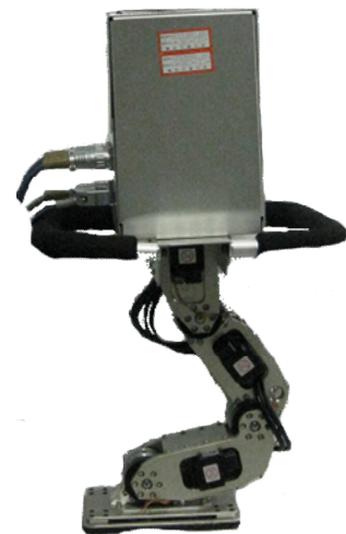
図2 4脚跳躍ロボット