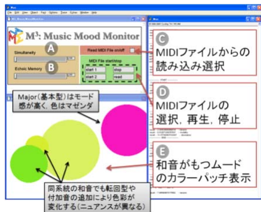
図3 音楽ムードビジュアライザ M 3 (M-CUBE) (藤澤ら, 2008)

(3) 本システムは入力音の MIDI 信号から各和音性の値を計算し、割り当てられたカラーのパッチをリアルタイムで出力する。システムの概要を図3に示す。入力形態にはキーボードとファイルの2通りがある。実験により、個々の和音を持つ微妙なニュアンスの違いを色彩の違いで表現することが確認された。