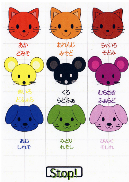
Figure 3 訓練画面