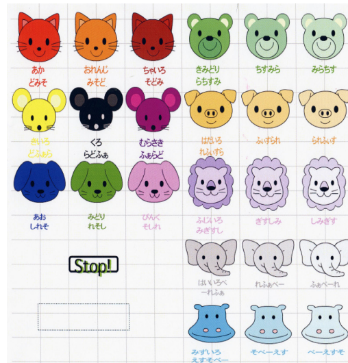
Figure 4 訓練画面