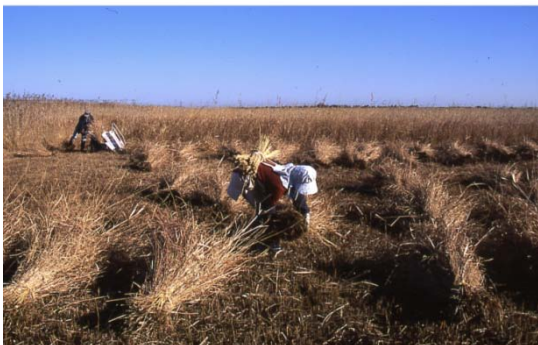
茨城県稲敷市上之島の茅場(シマガヤ)

茨城県稲敷市の浮島と上之島の茅場の面積、収穫量、収穫方法、茅場の維持管理の方法を明らかにした。