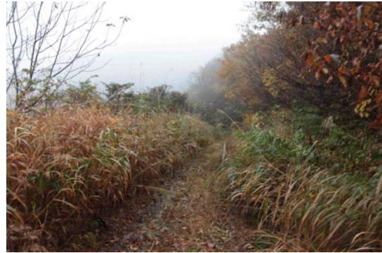
石川県金沢市湯涌の茅場(カリヤスモドキ)

また、標高の高い地域にカリヤスモドキが自生しており、それを利用して近年まで屋根が葺かれていた。これまでカリヤスの類いは、白川郷や五箇山のようなごく限られた山村でのみ使われてきた材料と考えられていたが、北陸や信越の比較的標高の高い地域に広く分布する材料であることが明らかになった。