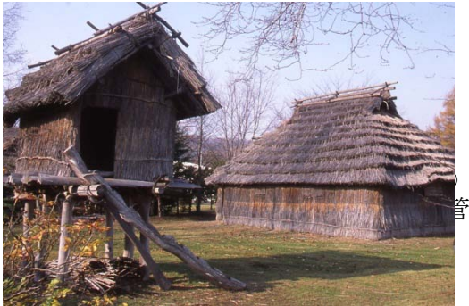
北海道日高町平取のアイヌのチセ 茅葺きの段葺き

北海道アイヌのチセの茅葺き屋根と茅葺き壁について現地調査を行い、材料、葺き方、道具について調査し、アイヌの茅葺き技術の詳細を明らかにした。