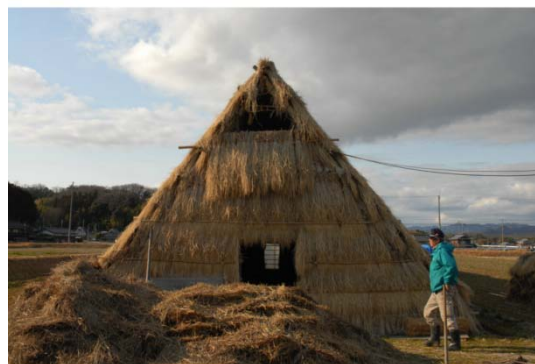
兵庫県三田市のウド小屋

兵庫県三田市における稲藁葺きのウド小屋について建設現場の調査を行い、稲藁葺きの材料の調達、葺き方、解体の方法までの一連の技術を明らかにした。葺き方は、軒付けを稲藁の束を真葺きとし、平葺きはあらかじめ作成したトマを逆葺きとして葺き重ね、棟仕舞は稲藁の束を編んでおさめる。トマの耐久性は約5年である。このようなウド小屋に見られるトマの逆葺きは、仮設建築や簡便な住宅の屋根として、近畿地方で広く行われていたものを今日に伝えるものとして貴重な資料である。