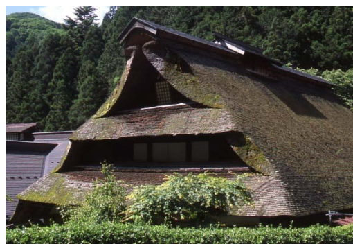
東京都桧原村数馬の杉皮葺き

奥多摩地方における杉皮を混ぜた茅葺きの現地調査を行い、杉皮葺きの分布と構法の詳細を明らかにした。