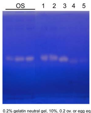
図1. ゼラチン含有中性ポリアクリルアミドゲルによるプロテアーゼ活性の検出。卵巣または卵の抽出物を試料とした。電気泳動後、酸性条件下に静置して反応させた。プロテアーゼ活性は白く抜けた部分として検出される。OSは、卵吸収中の卵巣抽出物、数字は用いた卵の産下後の日数を示す。