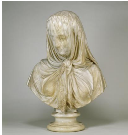
ベールの女 ジョヴァンニ・パティスタ・ロムバルディ作 ウィーン万博(1875年)にて収集