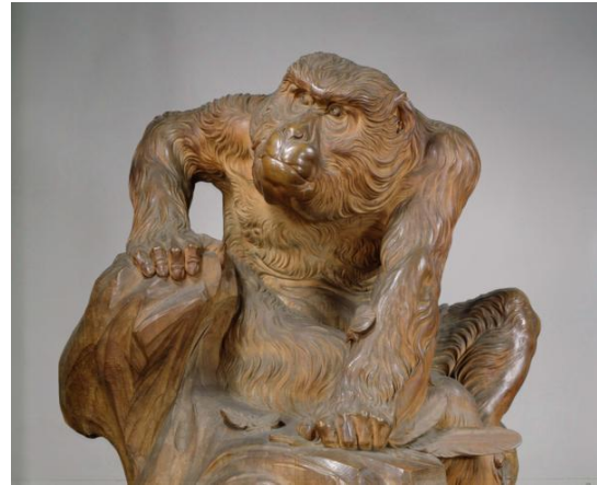
老猿 高村光雲作 シカゴ万博（1893年）出品作品

さて、列品録を中心に博物館に残る資料のデータ整備を実施したが、そのうちの日本彫刻関係資料については、現在の整理番号との照合も行った。また、該当作品の美術史的調査および画像データも完備した。それに基づいて『東京国立博物館図版目録 近代彫刻篇』を刊行し今後の研究の便を図った。また、作品の収蔵経緯、その後の活用などについても分析を行った。他施設の建築調査も実施し、東京国立博物館が与えた影響などについても分析を加えた。