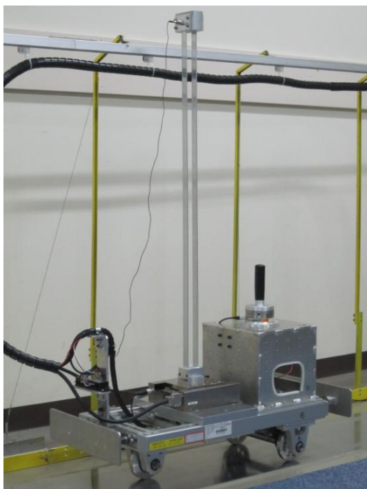
図3 1.0 Hzの振動系を搭載した パワーアシスト台車実験装置

(4) それまで人間-機械系機器における制御対象は剛体を前提としており、振動が問題となる柔軟物を扱った研究は行っていない。柔軟物が対象となる場合には、他の典型的な機械制御問題同様、運動制御と振動制御のトレードオフや、残余振動モードが励起されるスピルオーバー不安定など、高性能で安全な操作を実現する上で障害となる重大な問題が発生する。そこで、制御対象が柔軟物(振動系)である場合のパワーアシスト制御手法について検討した。高性能な振動制御を実現するためには、パワーアシストのアクチュエータとは別に振動制御用のアクチュエータを設けたほうが、アシスト制御と振動制御の間