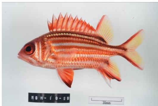
図. 本研究で採集されたアヤマエビス Sargocentron rubrum , MSM-19-291

本研究による集計作業の結果、駿河湾産魚類は45目約170科に属する1500種以上が認められた。科別の種類数をみるとハゼ科が最も多く(全種の約7%)、次いでベラ科、ハタ科、ハダカイワシ科(各科4%前後)、スズメダイ科(約3%)、ソコダラ科、アジ科、テン