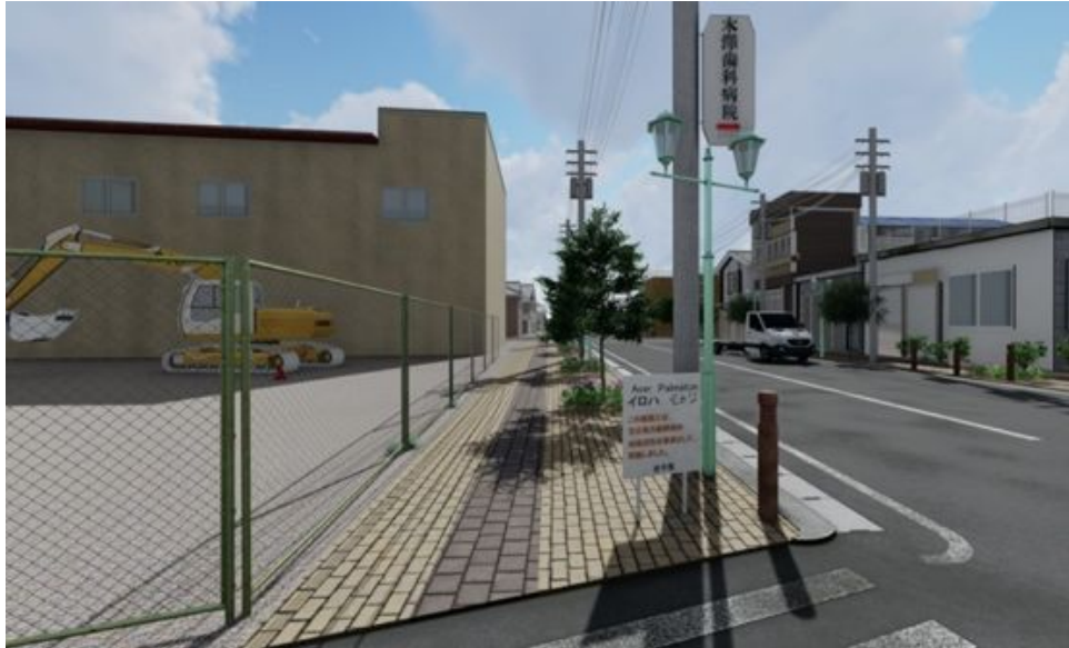
図2 山田駅の3D景観再現モデル例(駅前)