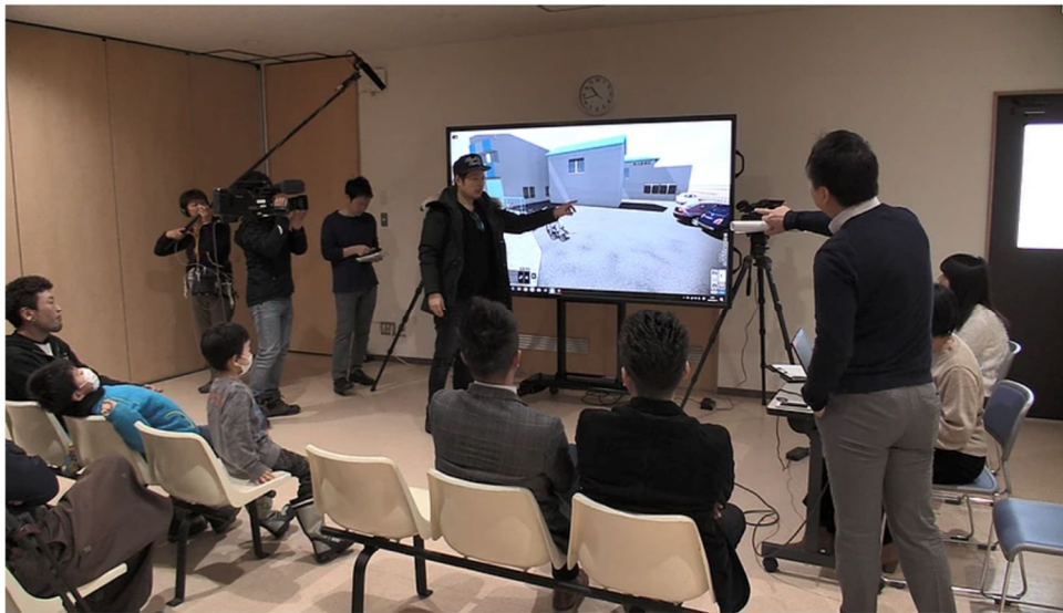
図3 山田町で行われたワークショップの様子