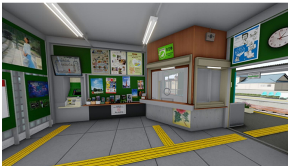
図1 山田駅の3D景観再現モデル例（駅内）

結果の一例として、山田町におけるヒアリング結果から得たデータを用いた共起ネットワーク分析の結果からは、駅内では、ベンチや椅子に座り、汽車の音を聴きながら、電車やタクシーが来るのを待っている記憶が抽出された。列車を待つ間、時間をつぶすために駅内のテーブルのところで友達とのんびりお菓子を食べ、本を読んでいた当時高校生の人もいた。冬には椅子の位置を変え、みんなストーブを囲むように座っている記憶を鮮明に思い出した被災者もいた。ストーブは室内の空間に安心感と快適感を与え、暖かく感じたと思出す人が多かった。屋内では景観構成要素も記憶の中に出てきたが、行動の記憶の多くは、雰囲気や全般的印象と関連付けられていた。また駅前で行われた生活行動については、移動ルートに関する記憶が詳細であった。郵便ポスト、電話ボックスや駅前の商店など、日常生活で利用する施設と行動の記憶が結び付けられている傾向が示された。屋内と屋外の比較から、屋内では雰囲気や全般的な印象が、屋外では個別の施設等の要素が日常生活の記憶と結び付けられていることが示された。