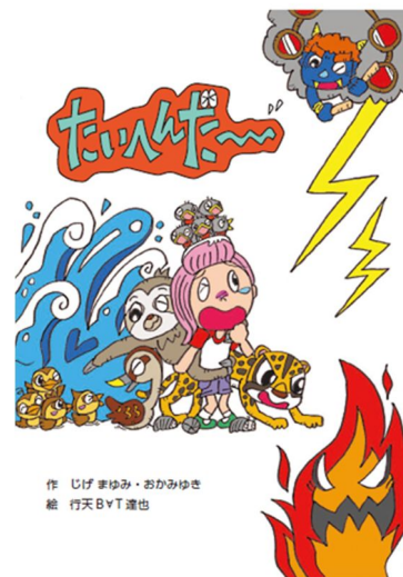
図2 .制作した防災教育絵本『たいへんだ〜』

子どもの身体的特徴、いわゆる頭が大きく腕・脚が短く転びやすいことをふまえ、体力・運動能力を考慮した子どもの自助力、自ら考えて行動できる力を高める防災教育が必要である。4歳児・5歳児の各年齢における体力・運動能力と防災教育を連携した具体的なカリキュラムを配信する防災教育絵本を作成し、実践を行った。子どもたちが避難する時に必要な力が理解でき、高評価を得られた。