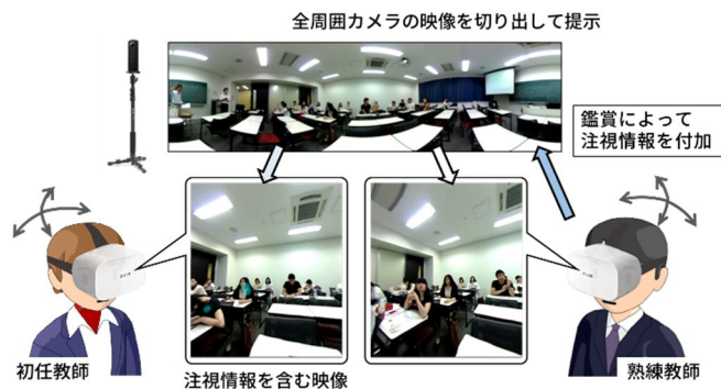
図1 全周囲カメラと視線追跡装置付ヘッドマウントディスプレイによる注視情報保存・再生システム

1). 具体的には、HMD に取り付けられた視線追跡装置によって、鑑賞者である熟練教師の注視情報(首の向きと視線位置)を記録した。その記録された注視情報を、別の鑑賞者である新任教師に対して提示する方法として、(ア)通常の視線位置提示に加え、(イ)映像切り取り方向の強制 (ウ)時系列視線位置のプロット の3種類を実装して、その効果について検討した。(ア)では対象学生だけの確に捉える(適合率1)参加者が現れ、(イ)と(ウ)では漏れなく捉える(再現率1)参加者が現れた。また、(ウ)に対して、最も視線追跡しやすい(平均:3.75)という評価を受けた。酔いは体調不良を感じた参加者はほとんどいなかった。これらの結果も踏まえて、注視情報の提示の方法、インターフェースに関する検討を行い、改善した。