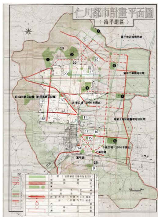
図2 仁川都市計画平面図(1964年)

1944年に発表された市街地計画による富平地区全域の計画図面の所在は不明だが、上記の1964年7月の街路網等の一部変更調書における添付図より当初の計画状況を読み取ることができる。1962年時点で位置変更された1箇所(昭和第5公園、17番)以外の22箇所は、当初の計画より変更することなく残った(図3)。23箇所の市街地計画公園用地は、公園規模に従って番号付けられ、「富平工業用地・住宅地」と「昭和地区」内に区画されていた