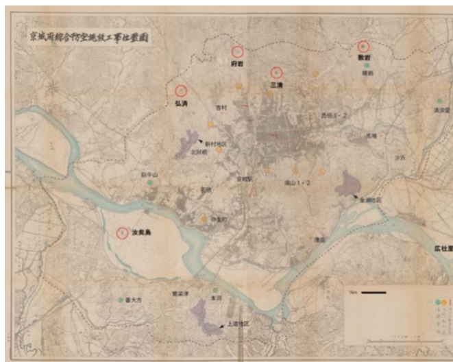
図3 京城府総合防空施設工事位置図（1942年）

1943年6月に開催された第6回市街地計画委員会は、緑地計画を踏まえた壮大な都市防空計