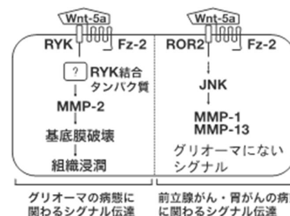
図 2 グリオーマにおける新規 RYK 結合タンパク質と組織浸潤に関わるシグナル分子

本研究の目的は、悪性グリオーマの浸潤性を標的とし、受容体を中心に据えた分子治療戦略の基礎を構築することである。グリオーマの予後不良の主要因となる高い浸潤能を抑えることができれば予後が改善し余命を伸ばすことが期待できる。一方、MMP 阻害薬の開発は、前述のように成功していない。また、Wnt は発生や細胞増殖など多彩な作用を示すため、単なる Wnt-5a 受容体拮抗薬では影響が広範にわたり、実用化は困難と予測される。新たな浸潤能抑制の標的を探索するためには、申請者らが見いだした Wnt-5a/RYK シグナルメカニズムによる MMP-2 の発現増大に注目する必要がある (図 1, 2)。シグナルメカニズムの解明には、タンパク質同士の相互作用に基づいた探索は不可欠であるが、従来では、RYK に関して目立った成果が上がっていない。申請者らは、この限界を打破するため、検出力の高い酵母 two-hybrid システムを用いることとした。ただし、この方法では酵母の核内でおとりタンパク質とライブラリー側タンパク質が結合することが必要であるため、膜局在シグナル等は、両タンパク質の核内での結合を障害する可能性がある。そのため、シグナル部位を除いた機能性ドメインを含む断片化 cDNA ライブラリーを使用することにより、膜タンパク質やオルガネラタンパク質を含めた網羅的かつ効果的なスクリーニングが可能となる (特許第 6998056 号)。新たに開発した方法により、RYK と相互作用するタンパク質の機能性ドメインを検索し、組織浸潤に関わる新しいシグナルメカニズムを明らかにする点が高い学術的独自性と創造性を有する。また、グリオーマ以外のがんに対しても浸潤性を標的とする新たな治療戦略を提供できる発展性がある。