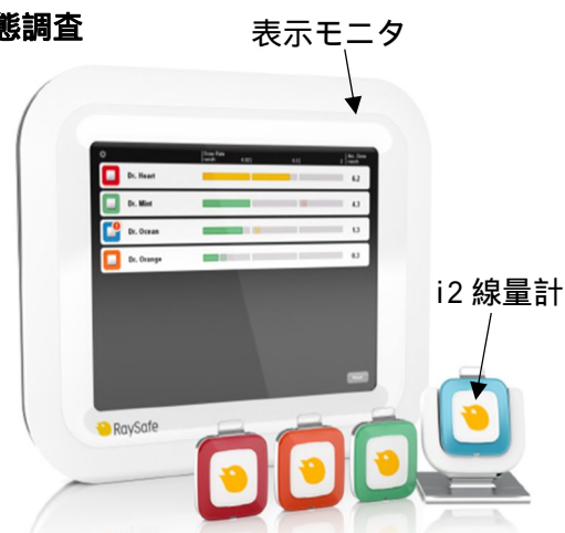
図 1 リアルタイム半導体線量計 (RaySafe i2, Unfors RaySafe 社, スウェーデン)

実際に放射線業務従事者の放射線リスクビューアを開発し臨床使用するには、①ウェアラブルカメラ②線量計③支持する装具 (マウント)④同期用ソフトウェアが必要である。