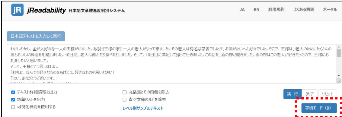
図 2 . テキストの入力画面