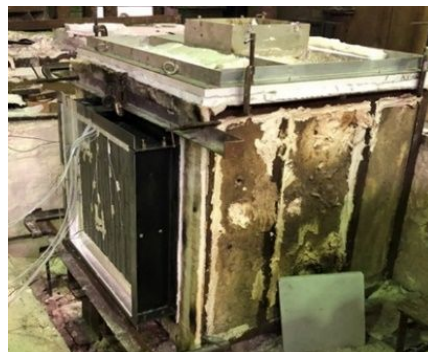
Fig. 1 小型加熱試験状況