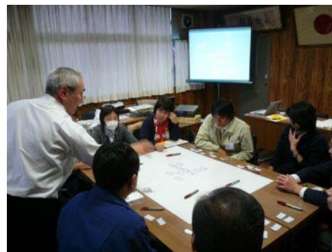
図1 デジタルペンを用いた簡易テーブルトップシステムGKJの運用の様子