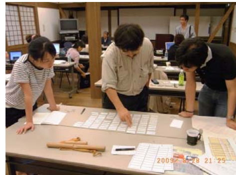
図 4 知識創造支援環境 GKJ の現場適用の様子

デジタル文字に即時変換する機能を用い、個人やグループの創造作業がより効率的に行えることを確認した。三年度目は実際のフィールドの問題解決のGKJが使えることを実証するため、七尾市能登島にでかけ住民の声を集め、各自が個人KJ法でまとめた。まとめたKJ法図解に市民および行政側で衆目評価された。四年度目は志賀町西浦地区の限界集落の問題を地元住民を巻き込み、ビジターである学生と一緒に課題解決地図を作製した。地元住民が衆目評価を行ったので、今回の試みは多くの波及効果を生みつつある。知識創造方法論としては、アナログ情報である写真K法による暗黙知とフィールドワークの結果をメモしたテキストである形式知との統合の試みである。