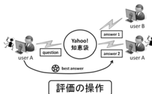
図 3：複数のアカウントを利用して質問とその回答を繰り返し Q&A サイトへ投稿し、回答者としての評価を操作しようとするユーザ

意見や表記選択などで不自然な一致が見つかった。このため、提案した方法で質問者と回答者が同一人物であることが疑われるユーザペアを検出できることがわかった。質問者と回答者が同一人物であることが疑われるユーザペアの例は、信頼できる知識の抽出に役立つだけでなく、複数のアカウントを用いてソーシャルメディアでのコミュニケーションを操作しようとするユーザの目的や方法について調査するのに役立つと考えられる。