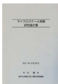
図4 マイクロスケール実験研究論文集

代表者が勤務する神戸女学院大学研究所主催の研究発表会や物理学実習の授業でも配布した。