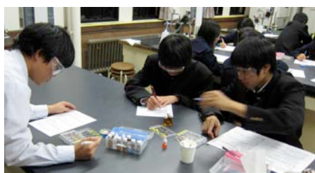
図3 電離平衡・溶解平衡の移動の実験に取り組む生徒

いずれの生徒も真剣に取り組み、アンケートの結果からも、マイクロスケール実験は楽しい、実験結果が良く理解できた等の回答が多くみられ、実践の成果が認められた [雑誌論文⑥, 学会発表③]