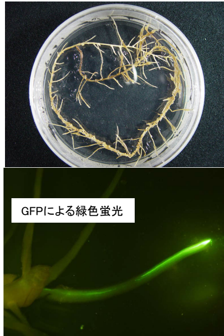
図2 CYP88D6 遺伝子導入培養細胞(毛状根)

1.0 \mu M のグリチルレチン酸処理により、ヒト大腸がん細胞 HCT116 の増殖を有意に抑制することを明らかにした。