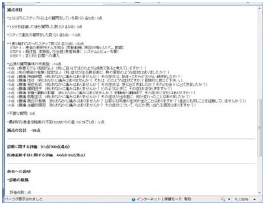
図 5: 医療面接評価結果の表示