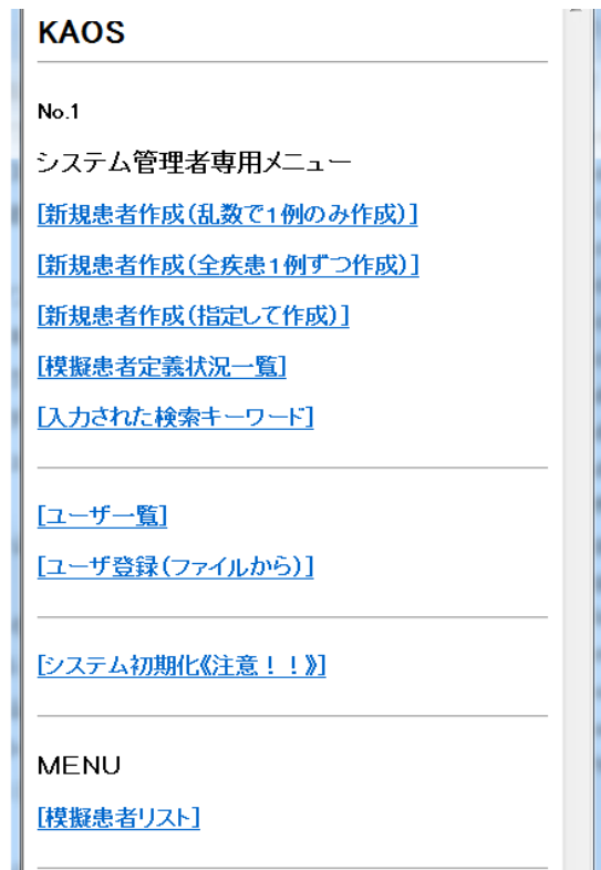
図1:システム管理者メニュー

図1に、システム管理者の操作メニューを示す。モデル患者は、システム管理者が疾患定義ファイルから作成したいモデル患者を指定して指示すると、乱数を利用して具体的な身長・体重・性別のモデル患者を作成するとした。