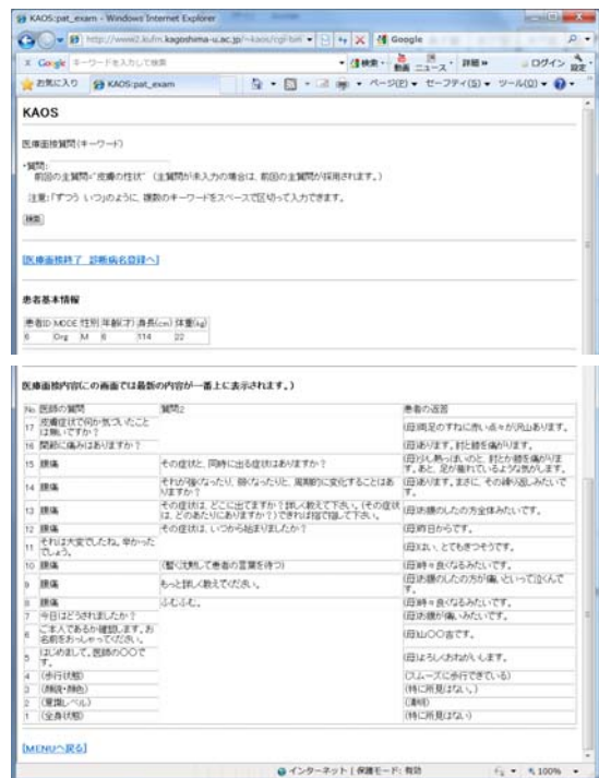
図4:医療面接実習中の画面

患者シミュレータは、質問項目に該当するモデル患者の答えを、モデル患者DBから抽出し、信頼度に合致するものを表示する。信頼度は、初期値を50%とし、医療面接における8つのステップ1)に該当する医療面接項目を実施し、かつ面接開始後2分以内にステップ5以上(直接的質問・システムレビュー)の質問をしなければ、10%ずつ増加し、ステップ違反があると、その内容に応じて3~10%信頼度が低下するとした。信頼度の変化の様子は診察中には患者の言動によってのみ伺うことができるが、躯体的な数値については診察中は確認できないようにした。信頼度の変化についてはカルテDBに記録され、結果の評価画面で確認することができる。