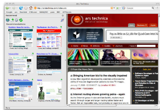
図2 : タグ情報を利用したWebページ推薦システム

図2に開発したシステムのインタフェース画面を示す。本システムではユーザが閲覧しているWebページ (右部) に対して、ユーザが好むWebページを提示することができる。図3に従来技術との比較実験結果を示す。推薦精度の適合率を比較した結果、提案手法 (RCF) が最も良い結果を示している。