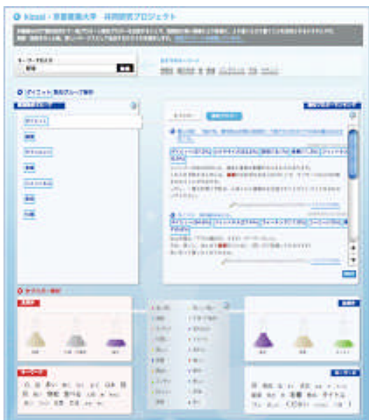
図4：高信頼性ブログコンテンツの呈示システム