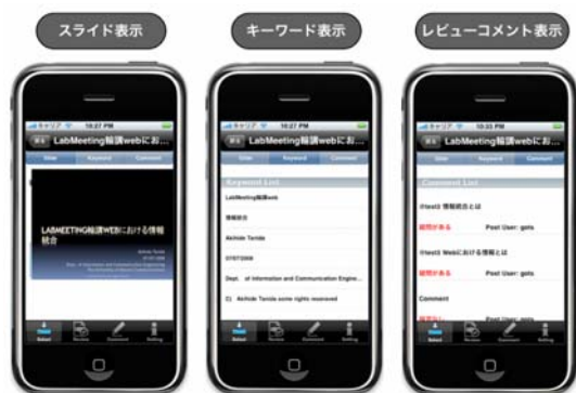
図 3. モバイル端末インタフェース