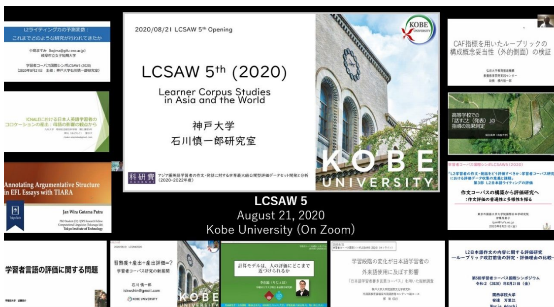
図 3 LCSAW5 の開催風景 (13 本の講演・発表)

International Symposium: The 5 th edition of the Learner Corpus Studies in Asia and the World (LCSAW) was organized on August 21, 2020 (9 invited presentations + 4 ordinary presentations). Then, the 6 th edition of LCSAW was organized on February 3, 2024 (6 invited presentations + 17 ordinary presentations). After the symposia, the conference proceedings were published.