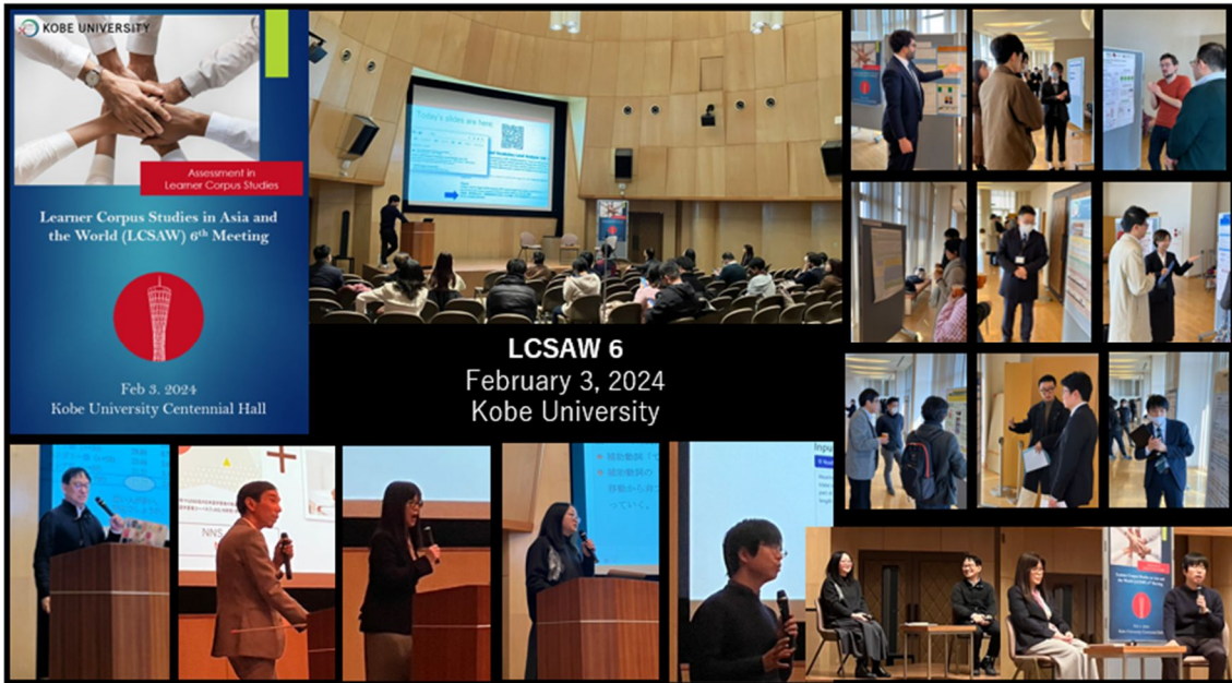
図 4 LCSAW6 の開催風景 (23 件の講演・発表を実施)

(3) 出版: GRA のデータなどを使い、単著書 The ICNALE Guide: An Introduction to a Learner Corpus Study on Asian Learners' L2 English (Routledge, 2023) が出版された。また、複数の Scopus 論文を含む、多数の論文が公刊された。