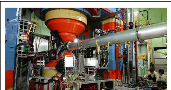
図1 建設中の実験装置

本研究課題では、J-PARC ハドロン実験施設の一次陽子ビームラインと実験装置を完成し、先行実験で