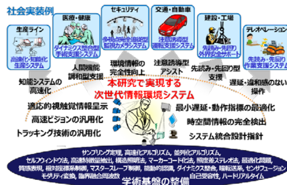
図2 研究成果の出口イメージ

本研究は、人間の目に見えない超高速時間領域で動作する超高速ビジョンを起点として、情報入出力それぞれの方論だけでなく、基盤技術を含め大幅に改善し、情報環境システムとそのインタラクションによる没入感とタスクパフォーマンスの限界を打破し、従来の設計理論を根底から覆す。これは、次世代の情報環境システムの基盤となるデザイン並びに動作原理を提案すると同時に、その中核をなす要素技術の創出・整備を行い、人間の知覚能力を超える高速インタラクション技術の体系的な学術基盤を整備するものとなっている。従来から研究代表者らは、新しい応用分野を開拓してきた実績があり、今回の課題設定も新しい応用分野を見据えたものであり、独創的かつ意義に富む多くの成果を生み出すことが期待できる。