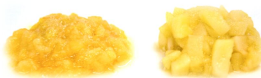
第1図 熱崩壊性品種‘ブラムリー’(向かって左)および非熱崩壊性品種‘ふじ’(同右)の加熱果肉

リンゴの消費形態は、主に生食用、加工用、調理用の3種類であるが、日本における消費の中心は、生食用である。一方、イギリスのように、cooking apple と呼ばれる調理用リンゴが消費の中心を占める国もあり、食の国際化の流れの中で、日本でも調理用リンゴの需要が高まっている。cooking apple を代表する品種としては、