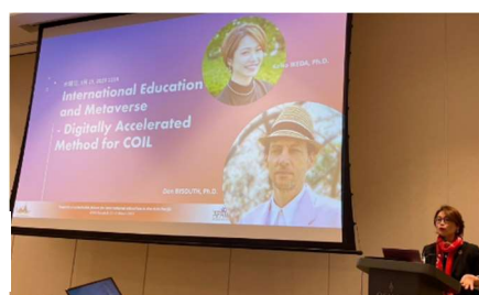
APAIE2023 (バンコク) の発表の様子

(3)本研究は、インターネットインターフェース上の工夫を加え、学習者間のソーシャルプレゼンス(互いの社会的存在性)を向上させ、学習者集団としての共同体構築を進めるものである。このような教育環境デザインで行う協働学習の効果を実証的に調査し、その成果を新しい教育モデルの提案へと実装することを目指した。2023 年度は、研究の成果を取りまとめ、2023 年度に開催された国際教育学会 (IVEC 2023、AIEA 2024、APAIE 2024) で情報発信を行った。特に、メタバースを活用した Virtual Exchange において、学習者間の活発な交流が進んだ場面と、実際の映像フィードが含まれる Zoom のような Web 会議ツール使用が志向される場合と、それぞれの場面による適性を観察し、その効果を確認した。