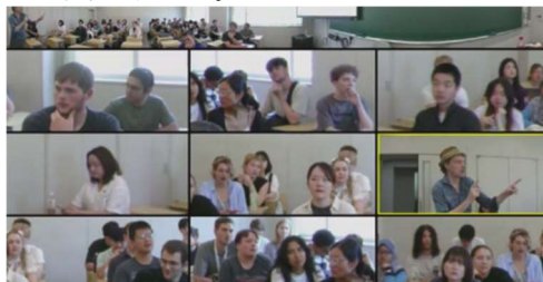
360度カメラ使用の授業場面

(2) よりインタラクティブな学習行動を促す目的で、VR の活用や360度会議カメラの活用(下図参照)、メタバース上での Virtual Exchange についても試行的な考察を行った。これには、学習者が仮想空間でどのように協働し、学習を深めていくのかを観察することが含まれ、これらの技術が学習効果に与える影響についても評価を行った。この取り組みにより、従来のオンライン学習では得られない新たな学習体験を提供し、学習者のエンゲージメントと学習意欲を向上させるための具体的な方法を模索した。申請者所属機関が提供する Virtual Exchange プログラムにおける学習者の行動分析を進め、本成果について 2021・2023 年度に実施された国際学会 (IVEC/International Virtual Exchange Conference や APAIE2023) で中間報告を行った。また、よりインタラクティブな学習行動を促す目的で、VR の活用やメタバース上での Virtual Exchange についても試行的な考察を行った。