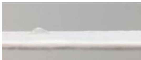
図1. HjCLによるネコザメ血漿の凝固促進 HjCL添加血漿をろ紙に滴下した図。凝固が生じているため、ろ紙に吸収されない。