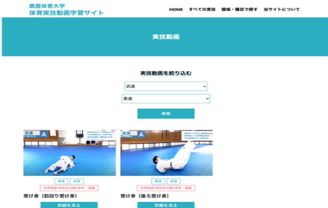
図2 鹿屋体育大学体育実技動画学習サイト