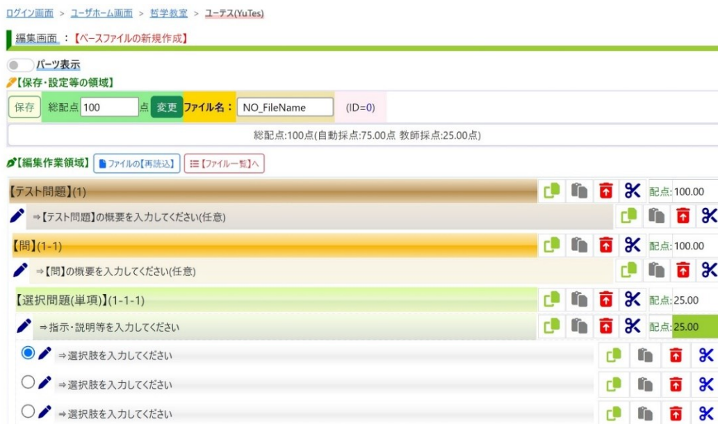
図 1 : テスト作成画面サンプル

ドの概念等、コンピュータに不慣れた教員にとってはハードルが高く、その後、テキストファイルのみでテストを作成する仕組みを導入したが、それでも操作性に問題が残るとの判断が生じたため、最終的には、「コピー&ペースト」で種々の問題を作成できる「超簡易版テスト作成機能」と呼べるものを実装することとなった。