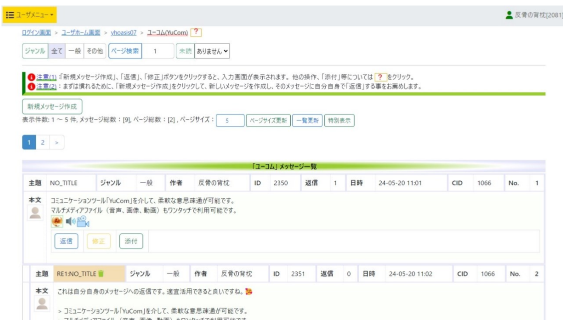
図 2 : コミュニケーション機能 (YuCom (ユーコム))

(7) コミュニケーション機能： スレッド型のコミュニケーション機能を設け、LMS の他にシステムの導入を図る必要のないようにした。