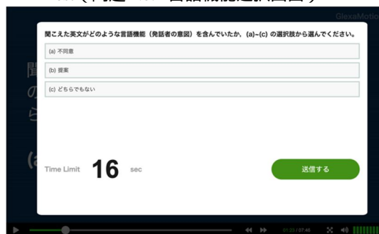
図 2. PREI Test (問題 No.1 言語機能選択画面)