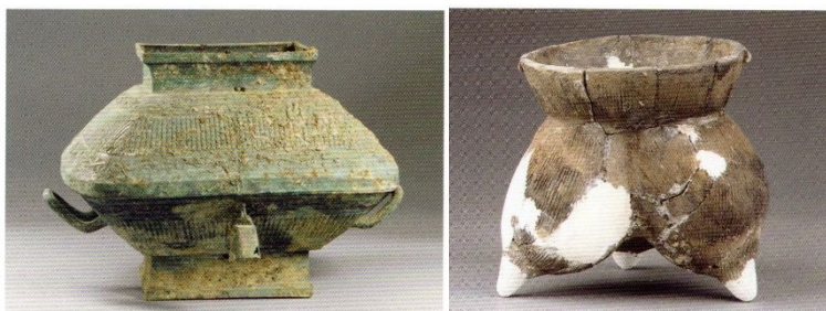
図2 石鼓山墓地出土の在地系青銅器・土器

西周王畿の西方疆域の実態については、少数ではあるものの手がかりとなる遺跡が発見されている。1970年代から80年代にかけて陝西省宝鶏市で発掘された弓魚国関連遺跡は、西周時代の諸侯国とは異なる文脈で有力集団が存在していたことを示す格好の発見であった。弓魚国は文献には全く現れず、出土青銅器銘文の解読からその名称が判明した集団である。出土した青銅彝器の規模から諸侯クラスの身分が想定されるが、数多くの在地製青銅彝器が大量に出土したことが重要であった。これらの在地系青銅彝器は大枠としての器種こそ王朝系青銅器と類似するが、その型式や組成は全く異なり、王朝との関係を強調する銘文も鑄込まれていない。西周王畿の近傍に王朝が想定する青銅器祭祀、すなわち礼制から逸脱した集団が存在していたことを証明した点が、弓魚国青銅器の持つ重要な学術的意義であった(西