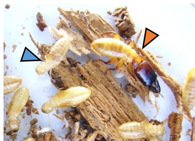
図 1. ネバダオオシロアリの成熟巣。兵隊（赤矢じり）とワーカー（青矢じり）。

ネバダオオシロアリの巣には、繁殖に専念する雌雄生殖虫、他個体の世話に従事するワーカー、巣の防衛に特化する兵隊が存在する。兵隊とワーカー（図1）は不妊個体であり、これらのカーストによる労働分業がシロアリ社会の発展には不可欠である。そこで本研究では、不妊カーストによる防衛行動に着眼して3つの実験を実施した。